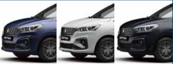
OXFORD BLUE PEARL PEARL ARCTIC WHITE MIDNIGHT BLACK METALLIC