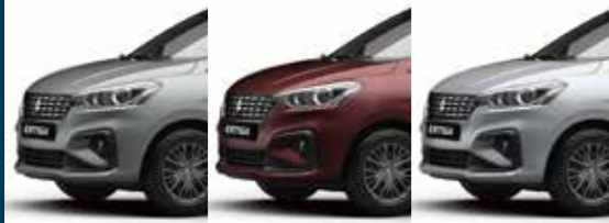
MET. MAGMA GREY AUBURN RED PEARL METALLIC SILKY SILVER